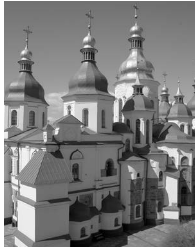
Рис. 1. Софійський собор у Києві. Ілюстрація до енциклопедичної статті «Архітектурна пам'ятка».

з зазначенням авторства. Не допускається використання ілюстративного матеріалу з Вікіпедії та інших електронних ресурсів. Як виняток, для пам'яток всесвітньої спадщини ЮНЕСКО можна запозичувати з відповідним посиланням ілюстративний матеріал з офіційного веб-сайту Комітету всесвітньої спадщини ЮНЕСКО – як публічне надбання, що використовується з некомерційною метою. Тут подано приклади ілюстрування статей про архітектурні пам'ятки України (рис. 1, 2), світу (рис. 3), сучасні світові архітектурні пам'ятки (рис. 4), біографічних статей (рис. 5, 6) та статей термінологічного характеру – від загальних понять (архітектурна спадщина – рис. 7; архітектурний стиль – рис. 8) до складних теоретичних побудов (архітектоніка – рис. 9) та конкретних термінів архітектурного пам'яткознавства (рис. 10, 11, 12).