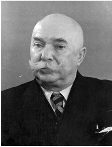
Рис. 6. Архітектор Павло Федотович Альошин. Ілюстрація до енциклопедичної статті «Альошин П. Ф.»