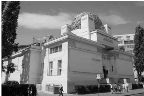
Рис. 8. Виставкова споруда «Сецесіон» у Відні (Австрія). Ілюстрація до енциклопедичної статті «Архітектурний стиль».