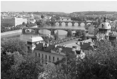
Рис. 7. Архітектурні пам'ятки в історичному центрі Праги (Чехія). Ілюстрація до енциклопедичної статті «Архітектурна спадщина».