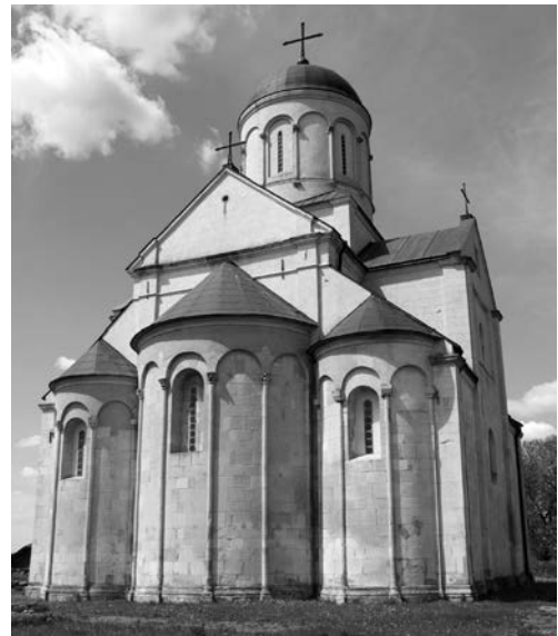
Рис. 10. Церква Святого Пантелеймона у с. Шевченкове Галицького району Івано-Франківської області. Ілюстрація до енциклопедичної статті «Апсида».