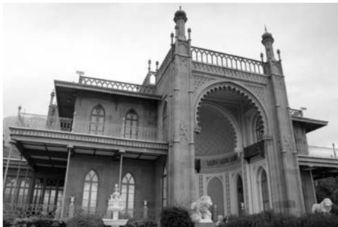
Рис. 2. Південний фасад Алупкинського палацу (АР Крим). Ілюстрація до енциклопедичної статті «Алупкинський палац-музей».