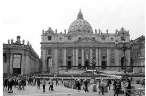
Рис. 3. Собор Святого Петра в Римі (Італія). Ілюстрація до однойменної енциклопедичної статті.