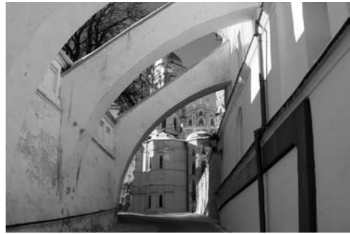
Рис. 12. Аркбутани друкарні в Києво-Печерській лаврі. Ілюстрація до енциклопедичної статті «Аркбутан».