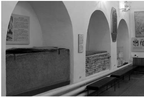
Рис. 11. Аркасолії в інтер'єрі Борисоглібського собору в Чернівці. Ілюстрація до енциклопедичної статті «Аркасолій».