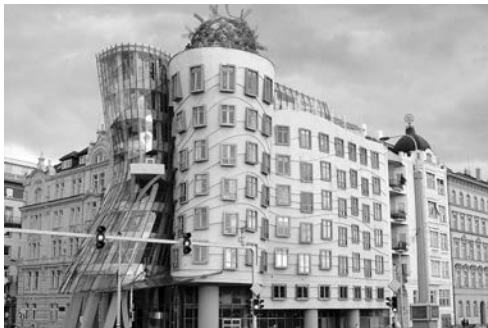
Рис. 4. «Танцюючий будинок» у Празі (Чехія). Ілюстрація до енциклопедичної статті «Архітектура».