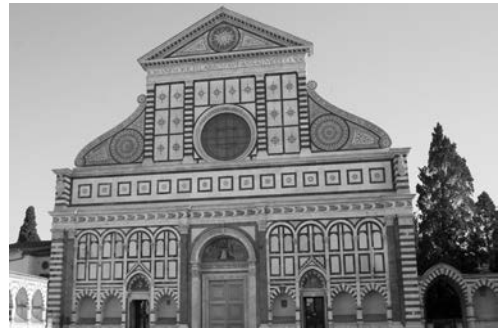
Рис. 5. Фасад церкви Санта Марія Новелла у Флоренції (Італія). Ілюстрація до енциклопедичної статті «Альберті, Леон-Баттіста».