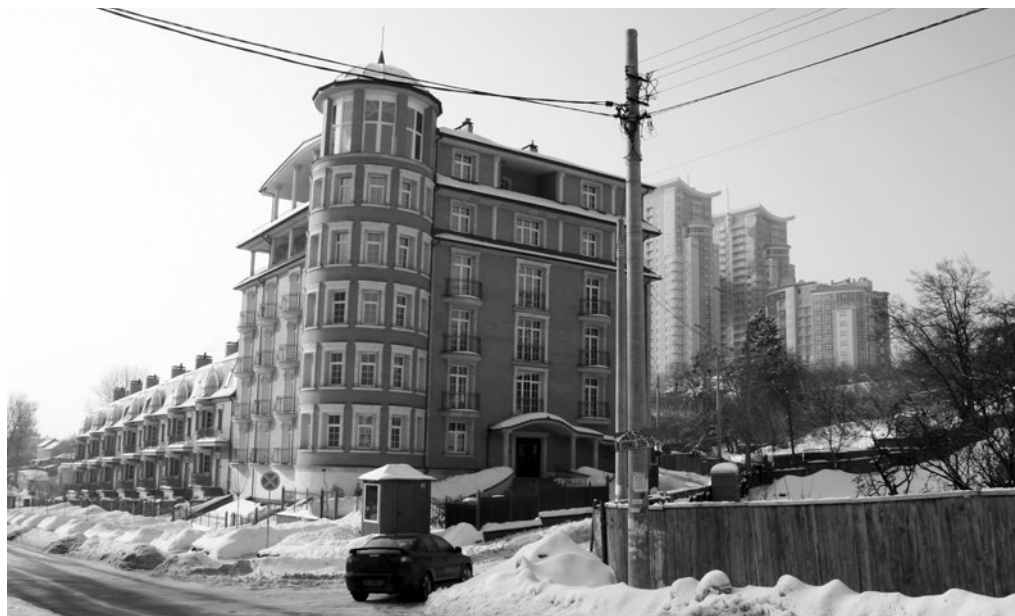
Рис. 5. Забудова вул. Тимірязевської біля межі території пам'ятки «Центральний республіканський ботанічний сад».