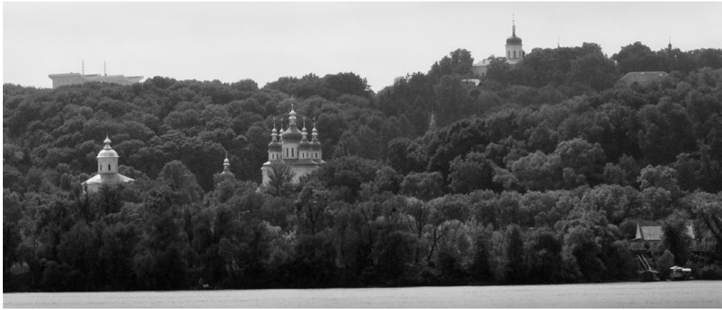
Рис. 3. Територія пам'ятки «Центральний республіканський ботанічний сад» з ансамблями Видубицького та Свято-Троїцького (Іонівського) монастирів. Панорама з р. Дніпра.