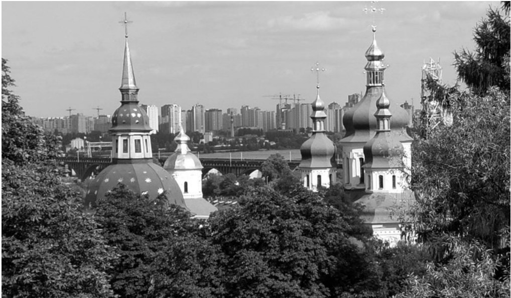
Рис. 7. Пам'ятки Видубицького монастиря та забудова лівобережжя р. Дніпра.