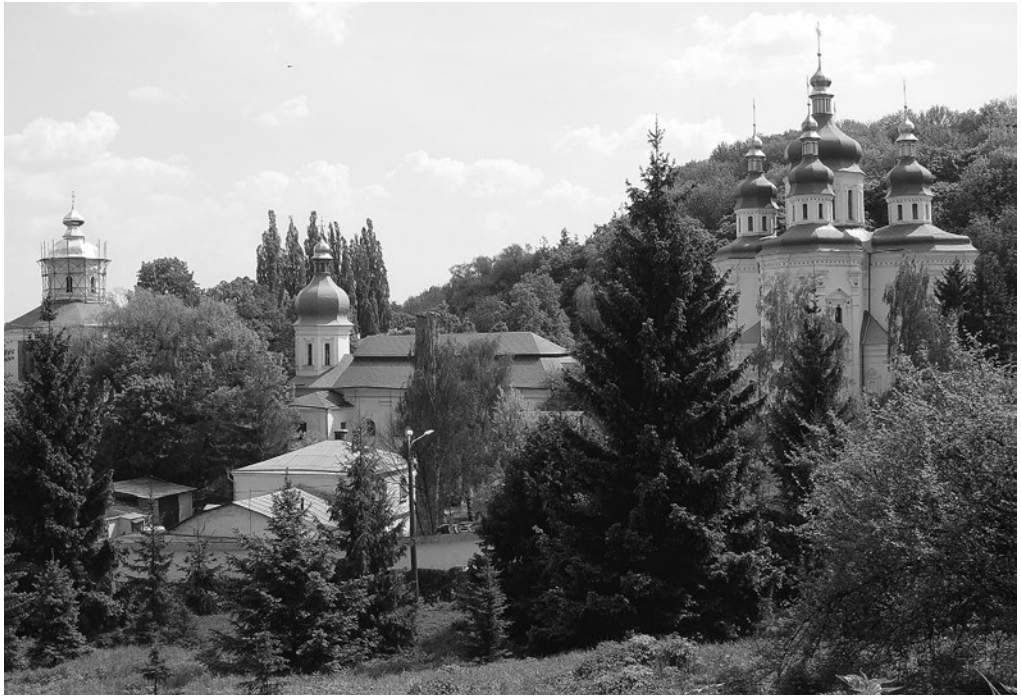
Рис. 4. Видубицький монастир. Видгляд з території пам'ятки «Центральний республіканський ботанічний сад».