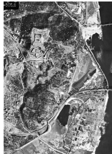
Рис. 2. Територія пам'ятки «Центральний республіканський ботанічний сад» на аерофотознімку 1943 р.