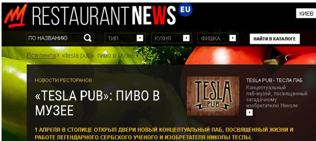
Рис. 4. Повідомлення про відкриття в Києві пивного бару «Tesla»

Здебільшого в таких експозиціях найчастіше представлені найпоширеніші предмети масового виробництва свого часу, що не несуть художньої, колекційної, історичної чи культурної цінності, не маючи виняткового значення для держави та не маючи рекомендації бути включеними до державного реєстру унікальних пам'яток. Часто в подібних «експозиціях» присутні й відверто копійні матеріали, адже отримання та використання автентичних зразків є неможливим. Так, у місті Києві функціонує паб «Tesla», який справедливо без приховування вказує на офіційній інтернет-сторінці про копійність матеріалів у своєму приміщенні та наголошує на використанні особливої концепції популяризації постаті всесвітньо-відомого фізика Миколи Тесли серед відвідувачів (Рис. 4). Підтримуючи позицію колективу цього закладу в прагненні зацікавити відвідувача історією життя та наукового внеску Миколи Тесли, варто зазначити, що втілена концепція попри наяву в ній суспільну корисність не може бути визначена офіційно як музей. Справжній будинок-музей Миколи Тесли розташований у місті Белграді (Сербія).