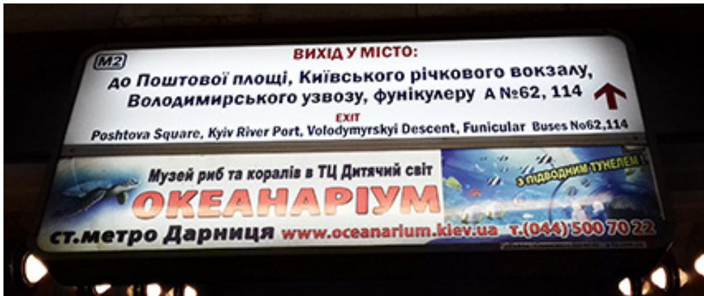
Рис. 2. Київський метрополітен. Реклама Музею риб та коралів в ТЦ «Дитячий світ», розміщена на вказівнику орієнту руху пасажирів станції «Поштова площа»

б зайвими й інформаційні огляди та історичні довідки біля цих предметів. На практиці спостерігаємо те, що персонал закладів харчування не володіє інформацією про старовинні елементи декору кафе на той випадок, якщо про це зацікавиться гість. Це цілком логічно, адже заклад громадського харчування чи кав'ярня не є музеєм. Водночас у разі наявності старожитностей у залі бачимо можливою співпрацю між такими закладами та музеями, де останні могли б розміщувати в закладі свої інформаційні стенди, натомість сприймаючи допомогу фахівців зі старовини в якісних і фахових наукових описах збережених там речей.