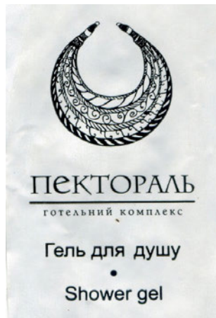
Рис. 6. Гель для душу готелю «Пектораль» із зображенням абрису скіфської золотої пекторалі, м. Переяслав, Київська обл.

Відомі випадки застосування зображень музейних предметів національного значення для народу України з метою створення позитивного іміджу приватного закладу (Рис. 6). Хоча у випадку з готелем «Пектораль» у туристичному місті Переяславі в Київській області враховано, що зображений на продукції готелю абрис (логотип закладу) не може вказувати та той чи той конкретний музейний предмет, що виключає необхідність підтвердити використання авторського права музею, де збережено автентичну золоту скіфську прикрасу.