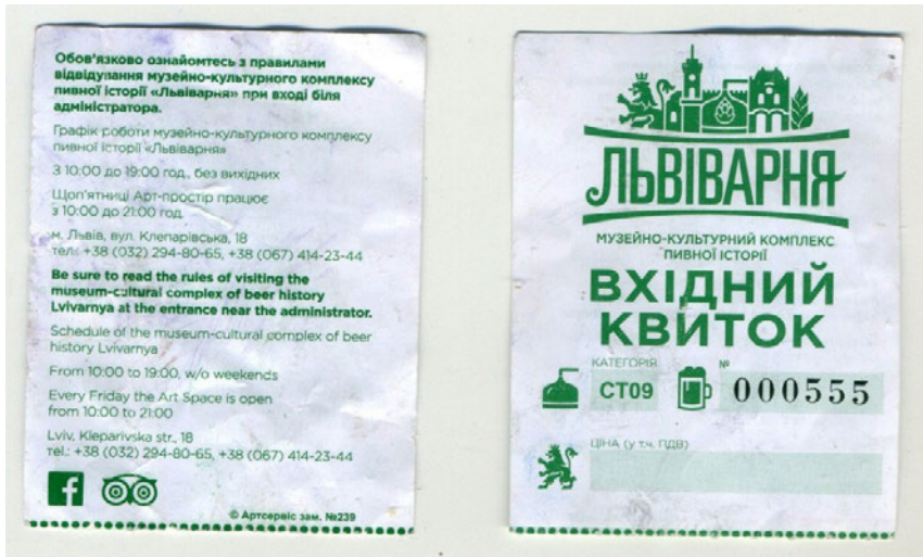
Рис. 5. Вхідний квиток до «Львіварні» – закладу музейного типу

На тлі популярності серед населення проведення часу в пивних барах виникають і нові, навіть непередбачені законодавством, види закладів, як «музейно-культурний комплекс» (Рис. 5). Очевидно, що розташований у Львові заклад з експозицією предметів, пов'язаних із таким характерним значним попитом виду харчової промисловості, як варіння пива, є досить популярним серед відвідувачів і відіграє позитивну роль у збільшенні туристичної привабливості міста. Натомість більш коректною назвою для подібних установ є термін «заклад музейного типу». Власники закладу також практикують видачу відвідувачам вхідного квитка, адже такий є ефективним інструментом маркетингу в музейній діяльності (Бойко-Гагарін & Макаренко, 2018).