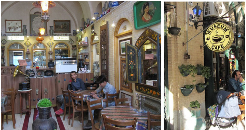
Рис. 3. Кафе з назвою «Museum Cafe», популярна серед туристів площа Імама, м. Ісфахан, Республіка Іран