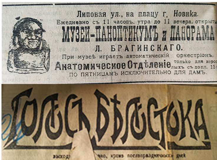
Рис. 1. Оголошення про відкритий у місті «Музей-паноптикум». Газета «Голос Білостоку», 1914 рік

час (Бойко-Гагарін, 2016). Дорадянські газети розміщують на своїх сторінках рекламу, пропонуючи містянам відвідати музеї, натомість рекламують справжні музеї в основному інформаційному джерелі того часу досить рідко. Яскравим прикладом може бути оголошення в газеті «Голос Білостоку» (Зелигман, 1914, с. 4) (Рис. 1), що запрошує відвідувачів оглянути досить незвичний на той час заклад «Музей-паноптикум та панораму», де, окрім реплік різних механізмів, опудал й анатомічних макетів, також лунає музика на грамофоні, навмисно названому в замітці досить незвично – «автоматичним оркестріоном». Як бачимо, увагу відвідувачів заклад намагається привернути, видаючи копійні матеріали за музейні предмети та застосовує змінену назву для відомого вже на той час технічного музичного програвача.